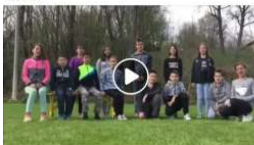
Срећан Дан планете Земље! "Не прљај. Немаш изговора!" школска 2018/19. година 6. разред